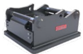
Adaptateur marteau/ broyeur